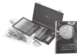
Gift (painting tool and shield) 20th Edition, 2019