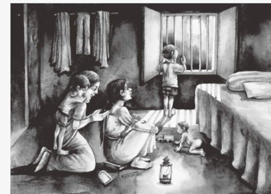
The 20th Grand Prize (2019) Moonlight Chyanika Das 11yrs. India