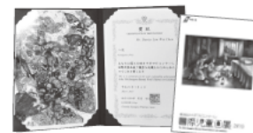
Certificate and Collection Book 20th Edition, 2019