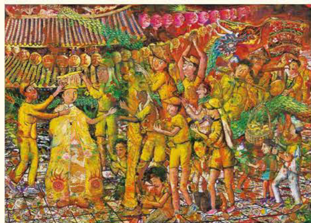
第20回展外務大臣賞 マツ祭りの巡礼の行列 チェン・ユンエン 12歳 台湾