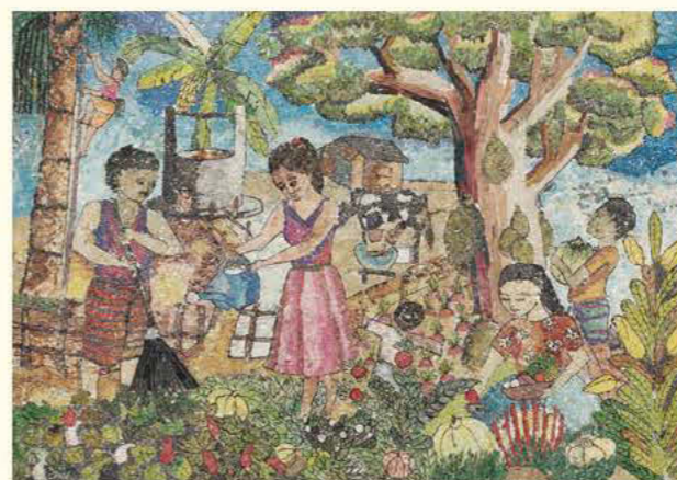
第20回展大賞 私のオーガニックガーデン I.K.ディマルカー・インドゥランピティヤ 12歳 スリランカ