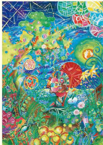
第20回展総務大臣賞 日本の詰め合わせ 山本一輝 13歳 真鶴町