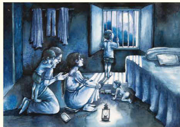
第20回展大賞 月明かり チャニカ・ダース 11歳 インド