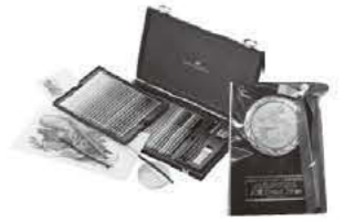
前回(第20回展)の副賞 (画材と表彰楯)