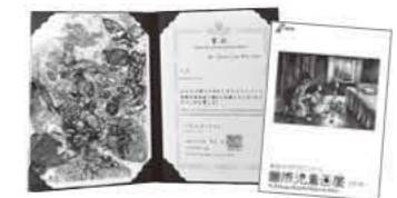
前回(第20回展)の賞状と作品集