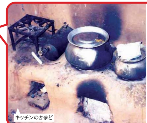
キッチンのかまど