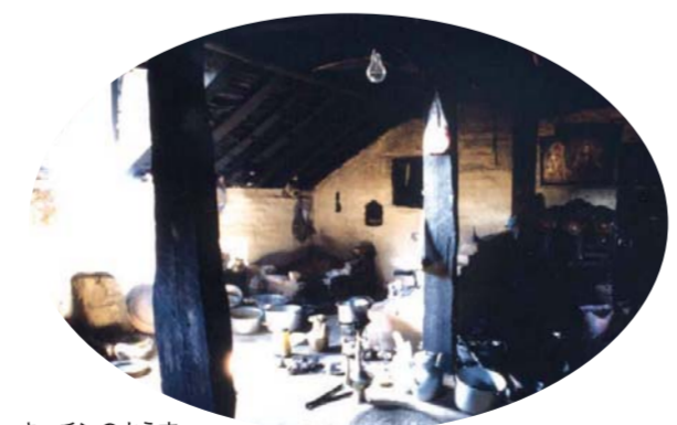
キッチンのようす