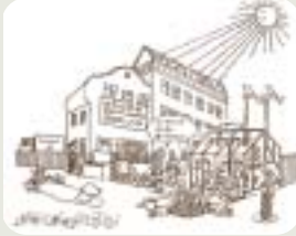
「自然と環境のファイル」より