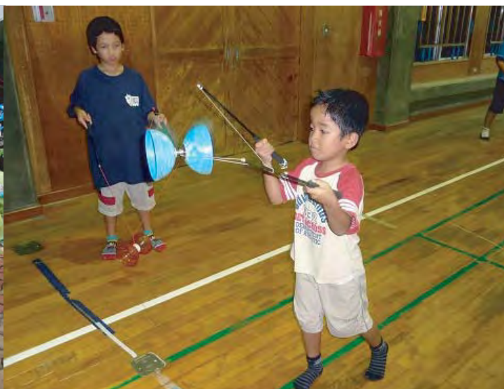
ちゅうごく 中国のこま

せかい あそ たいけん 世界のさまざまな遊びをこどもたちに体験してもらう コーナーです。