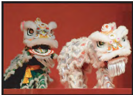
ちゅうごく ししまい 中国 獅子舞