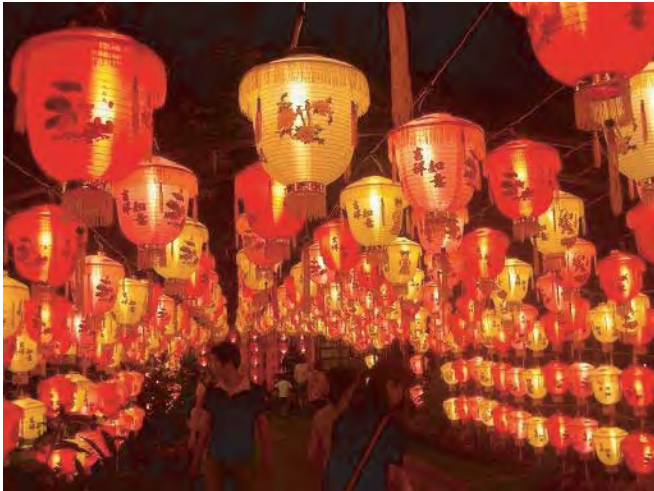
ちゅうごく まつ じ とうろう 中国 祭り時の灯籠