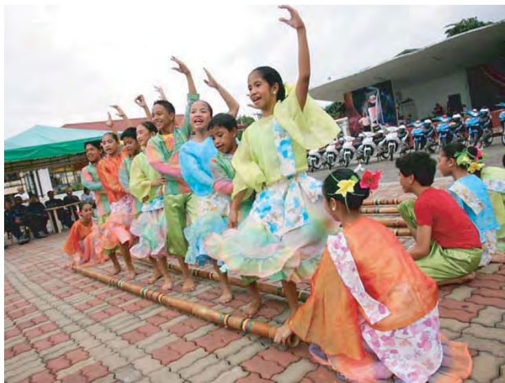
ふいりびん ばんぶーだんす フィリピン バンブーダンス