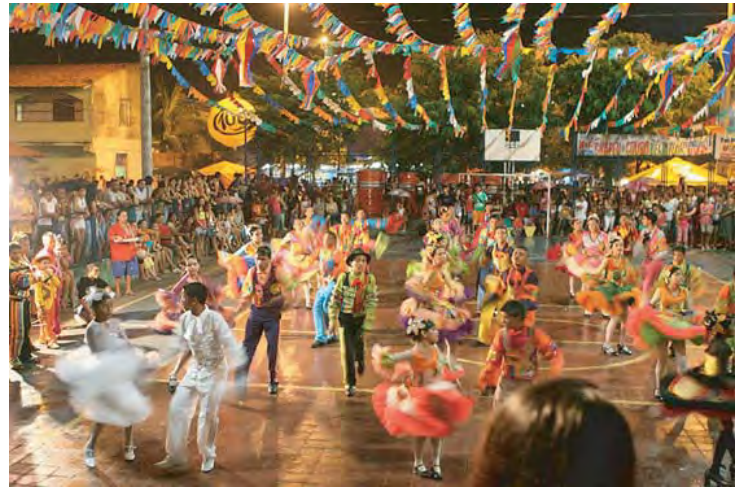
ぶらじる ふえすたじゅにーな ブラジル フェスタジュニーナ

せかい まつ てーま まつ つか とうろう 世界のお祭りをテーマに、祭りで使われる灯籠（とうろう）や かざり ころし おし 飾りなどを、講師に教えてもらいながらつくります。