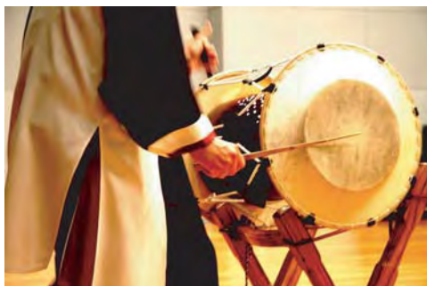
ちょうせん かんこく ちゃんご 朝鮮・韓国 チャンゴ