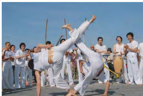
ぶらじる かぼえいら ブラジル カポエイラ