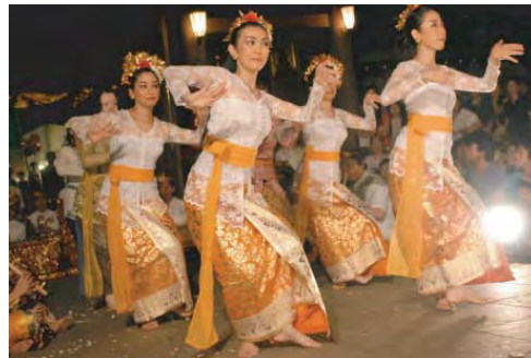
ぱり ぶよう バリ舞踊

2日間で6種のワークショップを開催します。いずれも出入り自由。 予約不要。おとなも子どもも参加できます。