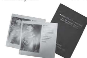
* premios, Certificado do mérito