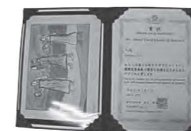
* Certificado do mérito