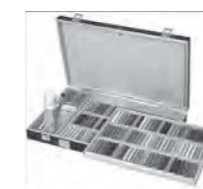
*Brindes da 18º exposição