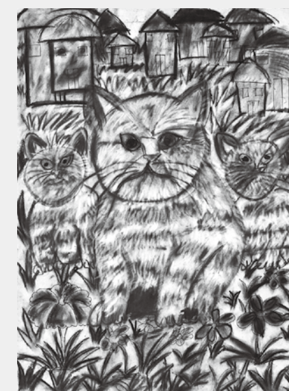
3 CAT FAMILY Ashraful Alam 9yrs. M Bangladesh