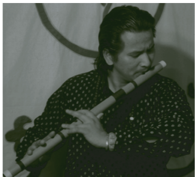
「ネパール民族音楽ふれあいコンサート」 24日 17時～18時

ネパール料理教室をはじめ、映画、民族音楽の集い、食を通じて南北問題を体験するワークショップや留学生によるトークなど、あーすぷらざ全館を使ってのイベントです。レストラン「メルヘン」では、ネパールデー特別メニューもあります。ブラザでネパールの食や文化に触れながら国際協力について、考えてみませんか?