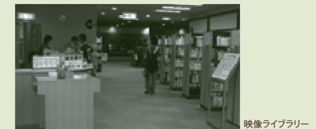
映像ライブラリー

2F映像ライブラリーには、民族楽器に関する図書があります 「民族楽器を楽しもう」株式会社ヤマハミュージックメディア 「民族音楽おもしろ雑学事典」株式会社ヤマハミュージックメディア 「大図説世界の楽器」株式会社小学館 など