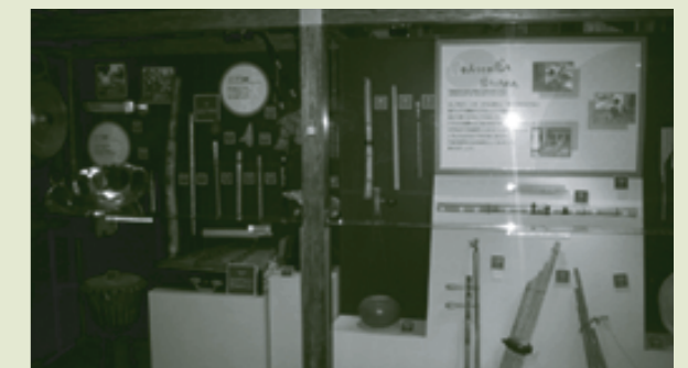
こどもの国際理解展示室