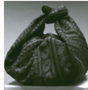
毛織 絨織 包み布 (ベルー)

日時：10月1日(金)～24日(日)9:00～17:00 入場料：無 料 場 所：あーすぷらざ3階 企画展示室 問合せ：地球市民学習課 TEL 045-896-2899 (担当:佐々木) ※祝日除く月曜休み