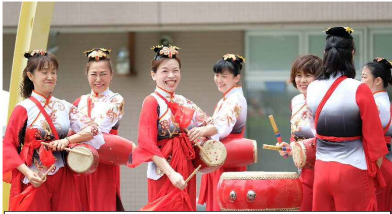
みんな集まれ！アイランド 世界のおどりや音楽が大集合！どこの国の音楽か分かる かな？