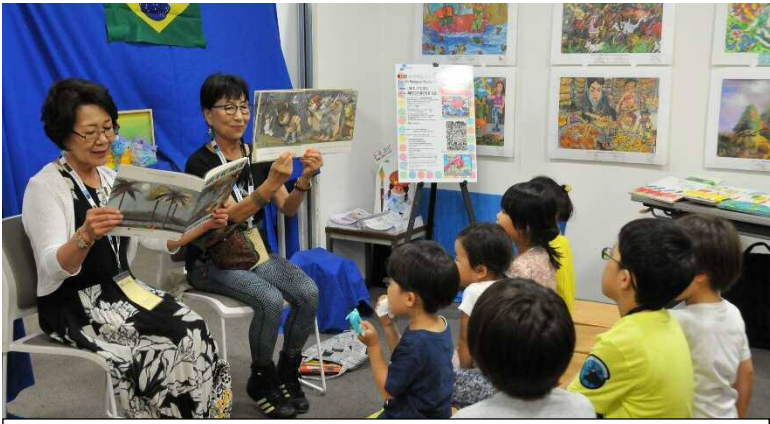
世界の絵本読み聞かせ 世界には、素敵なお話がたくさん！一緒に絵本の世界へ旅 しましょう！