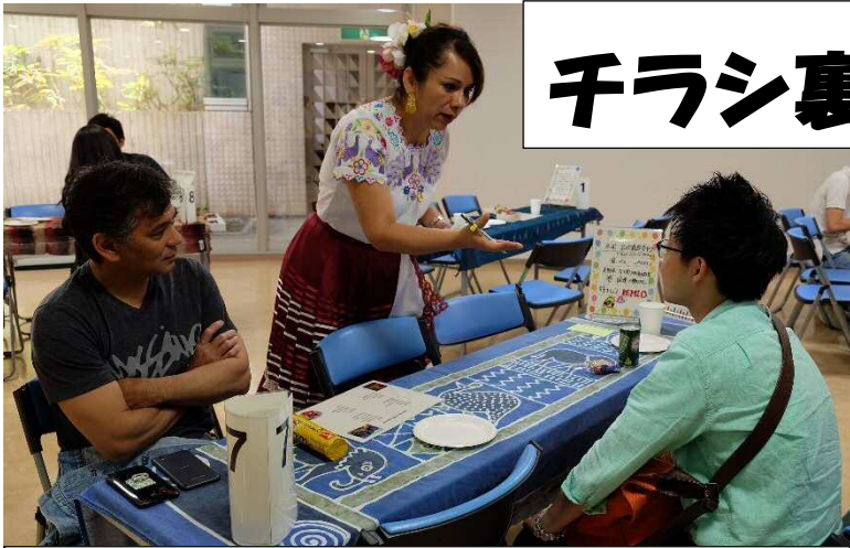
異文化交流カフェ 言葉が通じない！そんなカフェで、店員さんとコミュニケ ーションをとってみましょう。