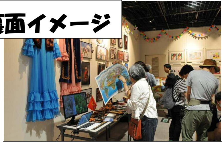
キルギス共和国ってどんな国？ どこにあるの？どんな人が住んでいるの？あまり知られ ていないキルギス共和国を感じてみよう。